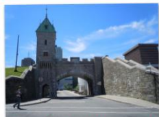
Een triomfboog in de stijl van een kasteel Het oude deel van Québec heeft een oude triomfboog die samen gevoegd is met de natuur van de historische stad.

We hadden gemiddeld 20 bezoekers per dag; van wie het meestendeel de rondleiding in het Frans volgden. Ik gaf de uitleg in het Engels wanneer dit nodig bleek. Ik ontdekte dat vele mensen een grote belangstelling hadden voor het leven en de geschriften van Marie. Haar leven en zending kunnen duiden was een hele deugddoende ervaring voor mij. Het grote Museum en de Kapel kunnen grotere groepen bereiken. Er zijn verscheidene aspecten van mijn tijd in Quebec waarover ik graag met u zou uitwisselen, vooral in verband met het Ursulinenklooster en de geschiedenis en de praal van het oude Quebec.