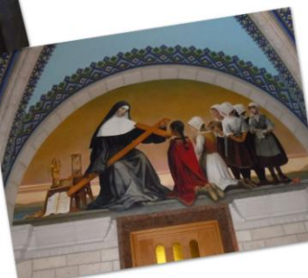
Een muurschildering van de Basiliek van St Anne de Beaupre Deze prachtige muurschildering toont de Zalige Marie van de Menswording die les geeft aan inlandse meisjes en Franse meisjes.

die haar navolgden in de loop der jaren. Haar brieven en andere geschriften geven uitleg over de eerste nederzetting, vooral over het werk met de Amerika-