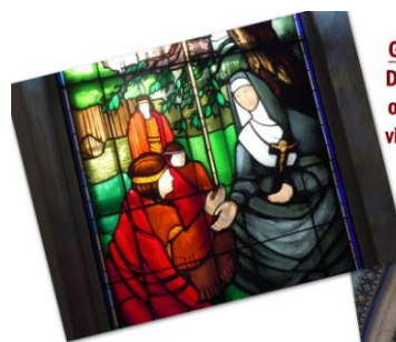
Glasraam-in-lood van Marie en kinderen De kapel van het Ursulinenklooster staat open voor het publiek. Dit glasraam is te vinden in de kapel en stelt Marie voor die de Indiaanse kinderen lesgeeft.

Waarlijk, de Ursulinen maken deel uit van de rijke geschiedenis van Quebec. Ik beschouw hen als de Bewaarders van de Erfenis van alles wat te maken heeft met Marie van de Menswording en de anderen